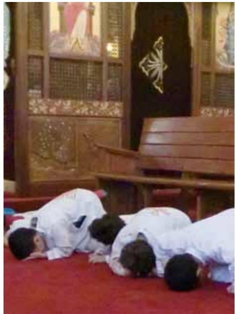
Koptische kinderen knielen tijdens de liturgie

Sinds de jaren zestig van de vorige eeuw wonen er Kopten in Nederland. Ze werden aanvankelijk geestelijk bediend door rondtrekkende priesters. In 1985 werd de eerste kerk aangeschaft. Dat was de koptische kerk in Amsterdam-Noord, eerder eigendom van de doopsgezinde gemeente. Het is nu de kathedraal van de gemeenschap in Nederland die sinds 2013 een zelfstandig bisdom is onder leiding van bisschop Arseny. De gemeenschap telt zo'n 8000 leden en er is een tiental priesters.