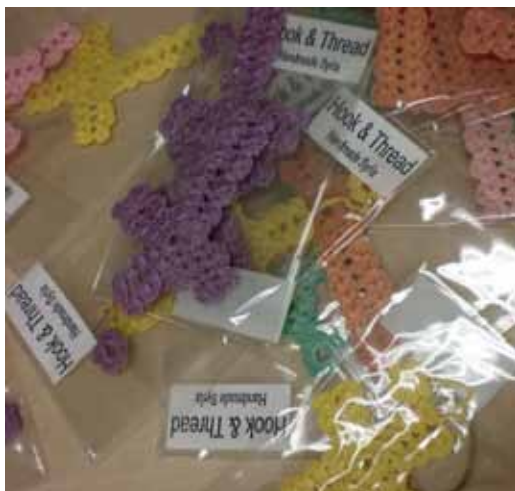
Haakwerk ten behoeve van Syrië

Plaisier: 'Als je teruggaat in de geschiedenis zijn het afsplitsingen van de Protestantse Kerk. Een deel van de pijn is geheeld. Ik vind het belangrijk die heling voort te zetten. We zijn zover dat we een vijf-kerken-overleg hebben. Als vijf kerken bespreken we indringend