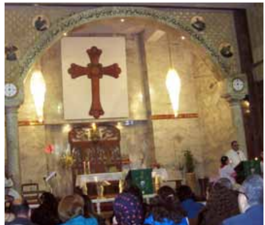
Kerk in Syrië

De actie is geslaagd als er in de kerken, bij de bevolking en bij de politiek (meer) betrokkenheid ontstaat bij de situatie van christenen en andere kwetsbare minderheden in Irak en Syrië; en als christenen en andere kwetsbare minderheden in die landen aan den lijve ervaren dat mensen elders in de wereld voor hen bidden en voor hun rechten opkomen.