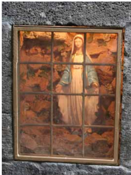
In een muur in Syrië

Zes November, laatste les: ze zouden vertrekken naar Wassenaar. Ze kwamen laat, hadden weinig geslapen. Er is ‘s nacht om 3.00 uur gevochten, een soenniet met een sjiïet. Vraag ik: ‘Nou nou, vochten ze over de profeet Ali?’ ‘Nee, natuurlijk niet! Over een deken.’