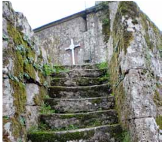
Naar het kruis

De verzamelde kerken in Tirana onderstreep-ten de onderlinge solidariteit. Ze erkenden dat ze zich ook zelf schuldig hebben gemaakt aan intolerantie tegenover andersdenkenden. 'We vragen vergeving aan elkaar en bidden voor nieuwe wegen om Christus samen te volgen.' De kerkelijke leiders zeggen toe meer te willen luisteren naar de ervaringen van christenen, kerken en allen die vervolgd worden. Ze vragen 'alle vervolgers die discrimineren (...) hun misbruik te beëindigen, en het recht