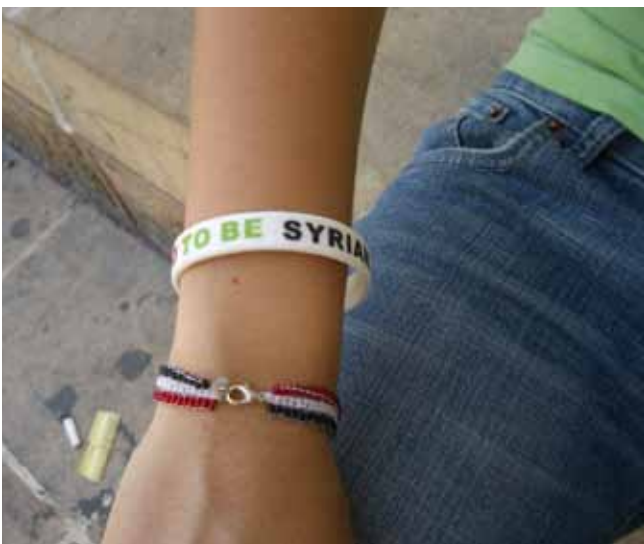
'Proud to be Syrian'

In MissieNederland en de Raad van Kerken zijn netwerken ontstaan van initiatieven in opvang van en bemiddeling voor de vluchtelingen in Nederland. MissieNederland en de Raad van Kerken hebben speciale website-onderdelen gecreëerd waarop diverse initiatieven omtrent de opvang van asielzoekers staan ( http://www.missienederland.nl/vluchteling ; en http://www.raadvankerken.nl/pagina/1474/vluchtelingen ). De sites zijn bedoeld ter informatie, inspiratie en afstemming voor kerken en organisaties overal in Nederland.