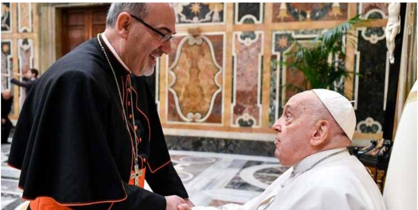
Patriarch Pizzaballa en Paus Franciscus

Bron: Vatican News 15 januari 2024, https://www.vaticannews.va/en/vatican-city/news/2024-01/pizzaballa-gaza-christians-jordan-dialogue-peace-pope-francis.html ●