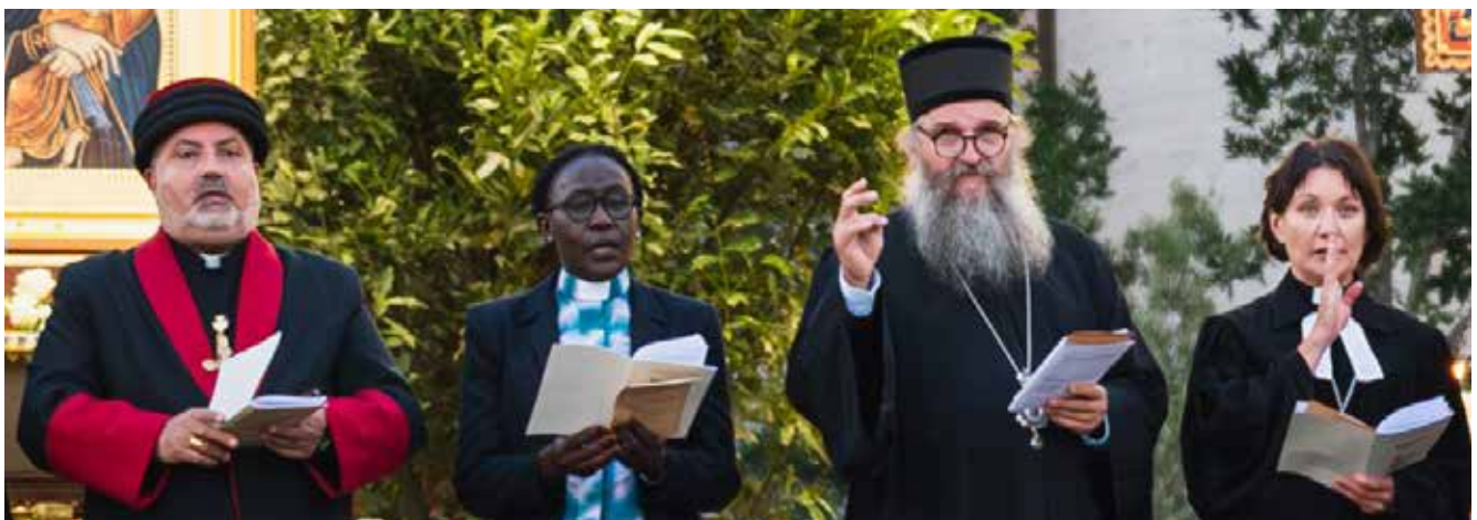
Patriarch Theophilus III van Jeruzalem zegent de deelnemers aan Together, samen met Paus Franciscus en vertegenwoordigers van het wereldchristendom.