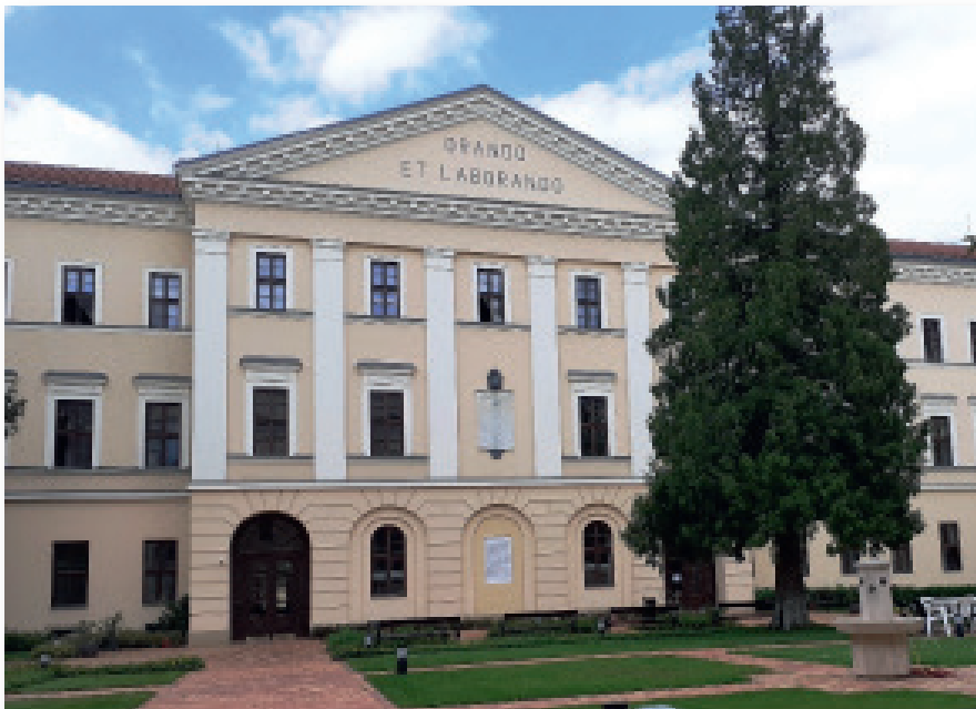
Református Kollégium in Debrecen

Soms vraag ik me af of we ten diepste eigenlijk wel willen dat onze gebeden worden verhoord. Niettemin blijft het van het grootste belang dat het oecumenisch ideaal in onze tijd blijft voortleven en vooruitgang boekt. We mogen als volgelingen van Jezus Christus